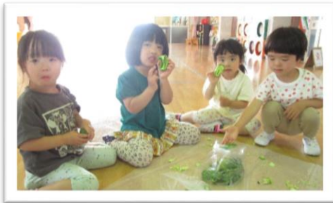
3歳児うめ組 ピーマンの種取り